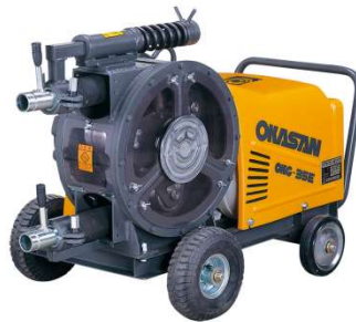
モルタル圧送ポンプ