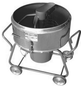
ダマカットミキサー