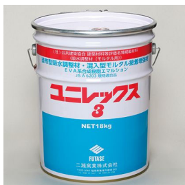
公共建築協会 建築材料等評価名簿掲載材料 吸水調整材(モルタル用) ユニレックス3 [18kg/缶] 塗布型吸水調整材 (EVA系合成樹脂エマルジョン)