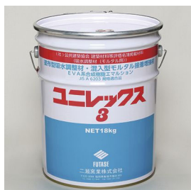
公共建築協会 建築材料等評価名簿掲載材料 吸水調整材(モルタル用) ユニレックス3 [18kg/缶] 塗布型吸水調整材 (EVA系合成樹脂エマルジョン)