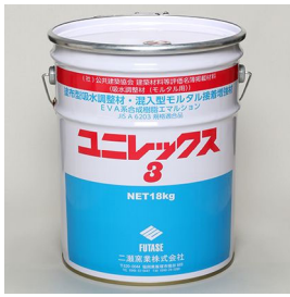
公共建築協会 建築材料等評価名簿掲載材料 吸水調整材(モルタル用) ユニレックス3 【18kg/缶】 塗布型吸水調整材 (EVA系合成樹脂エマルジョン)

JIS A 6916(CM-1)規格適合モルタルとしてご使用される場合は、ユニレックス3の混和量(1.5kg)を必ず遵守して下さい。