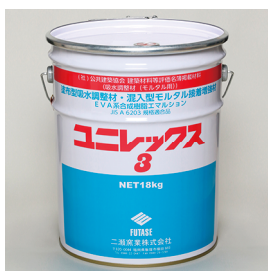
(一社) 公共建築協会 建築材料等評価名簿掲載材料 吸水調整材 (モルタル用) ユニレックス3 [18kg/缶] 塗布型吸水調整材 (EVA系合成樹脂エマルジョン)