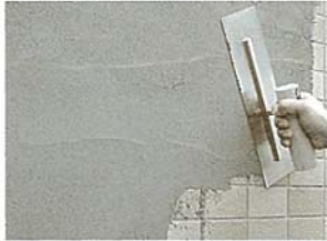
タイルonタイル施工例

■ 特殊ファイバー繊維配合内外装用タイル張付材 兼下地調整材 (ポリマーセメントモルタル)